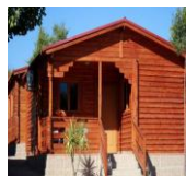
Camping Carlos III et paquito ??

Adresse: la Carlota - à 25 kms de Cordoue -